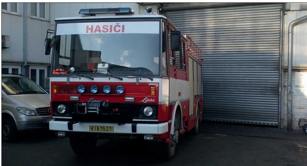
Jednotka při požární asistenci v Bonatrans, a. s. (2017)

Jednotka je vybavena zásahovým cisternovým automobilem LIAZ K101 CAS-25, který byl sice vyroben již v roce 1985, nicméně díky finančním prostředkům města prošel v roce 2013 celkovou opravou a rekonstrukcí v hodnotě téměř 1,5 milionu korun. Je dostatečně vybaven veškerou technikou, např. elektrocentrálou s výsuvným stožárem pro osvětlení, navijákem, kalovým i plovoucím čerpadlem, motorovou pilou a dalšími technickými prostředky. Jako dopravní automobil 1+8 má sbor k dispozici VW Crafter pořízený v roce 2015.