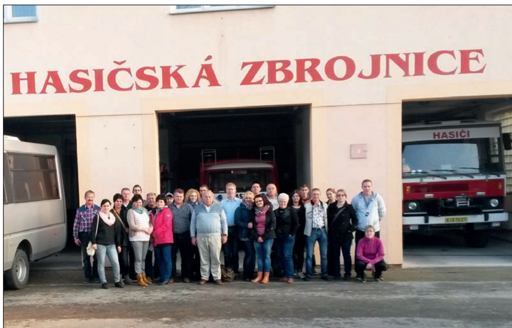
Návštěva polských kolegů v ČR 2015