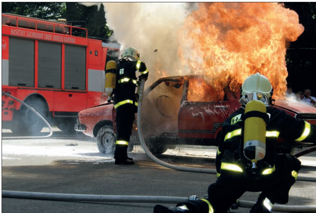
Nahoře: ukázka činnosti – likvidace požáru vozidla; dole: likvidace bodavého hmyzu