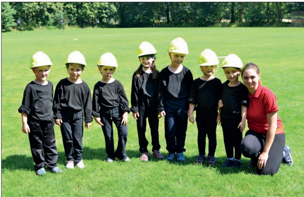
Nahoře: mladí hasiči – přípravka 2017; dole: kolektiv mladých hasičů 2016