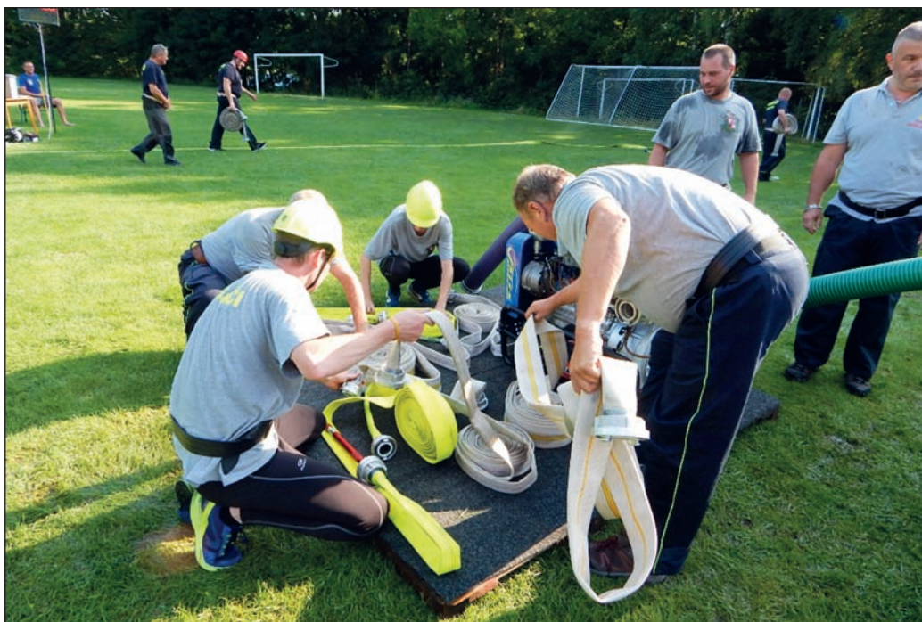
Družstvo veteránů při přípravě na start (22. 7. 2017)