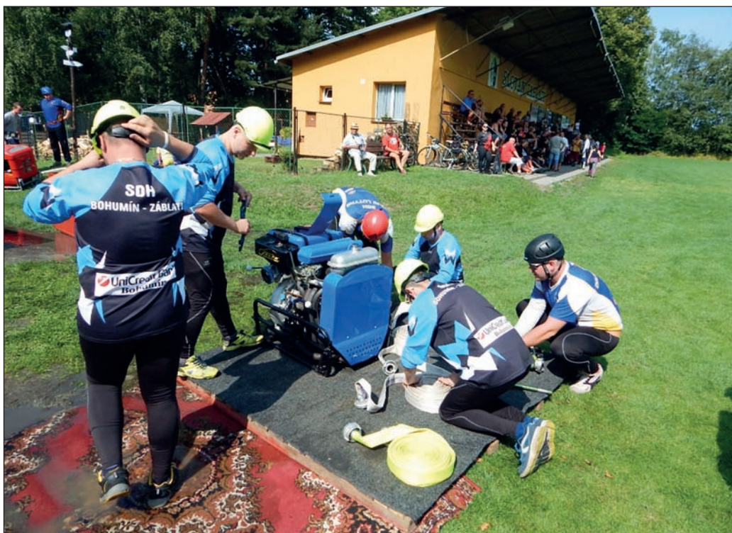
Družstvo domácích mužů při přípravě na start (22. 7. 2017)