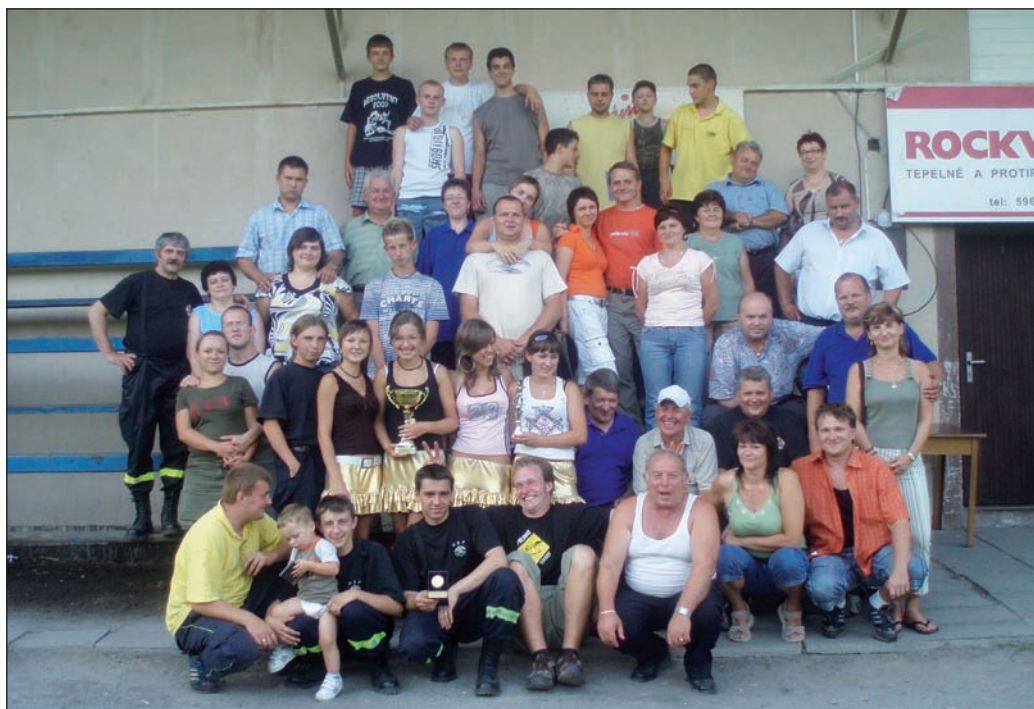
Záblatí, ČR, 21. 7. 2007