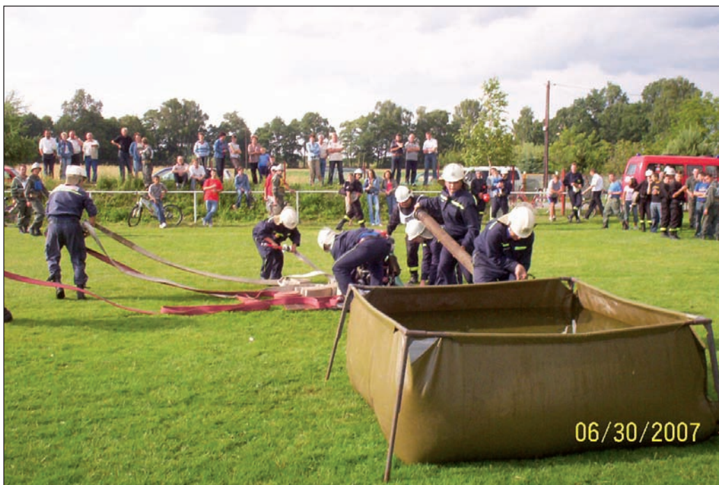
Na soutěži v Polské republice

Koncem roku 2006 jsme navázali družební styky s dobrovolnými hasiči z O.S.P. Zabłocie v Polsku. Na první oficiální kontakty mezi výbory obou sborů navázaly velmi přátelské vztahy mezi samotnými členy. O jejich dobré úrovni svědčí jak dvě návštěvy našich hasičů u polských kolegů včetně účasti na jejich soutěži, tak dvě návštěvy polských přátel u nás. Vyvrcholením dosavadních kontaktů byla návštěva polských přátel v Záblatí v červenci 2007. Pro polské kolegy jsme uspořádali celodenní program včetně návštěvy Hasičského muzea v Ostravě a exkurze v sídle HZS MSK v Ostravě-Zábřehu. Na to navazovala účast polských hasičů na 3. ročníku „Memoriálu pana Aloise Škuty“ (jejich družstvo zvítězilo v kategorii „veteráni“, soutěž zahájily svou skladbou mladé polské hasičky – mažoretky a dospělí předvedli zásahový vůz Magirus). Při příjemném posezení na zahradní slav-