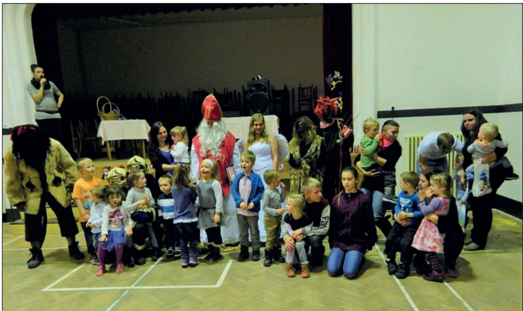
Mikulášská nadílka 2017