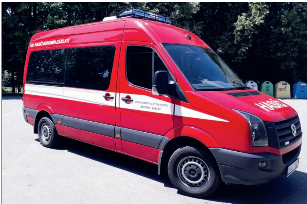
Dopravní automobil VW Crafter