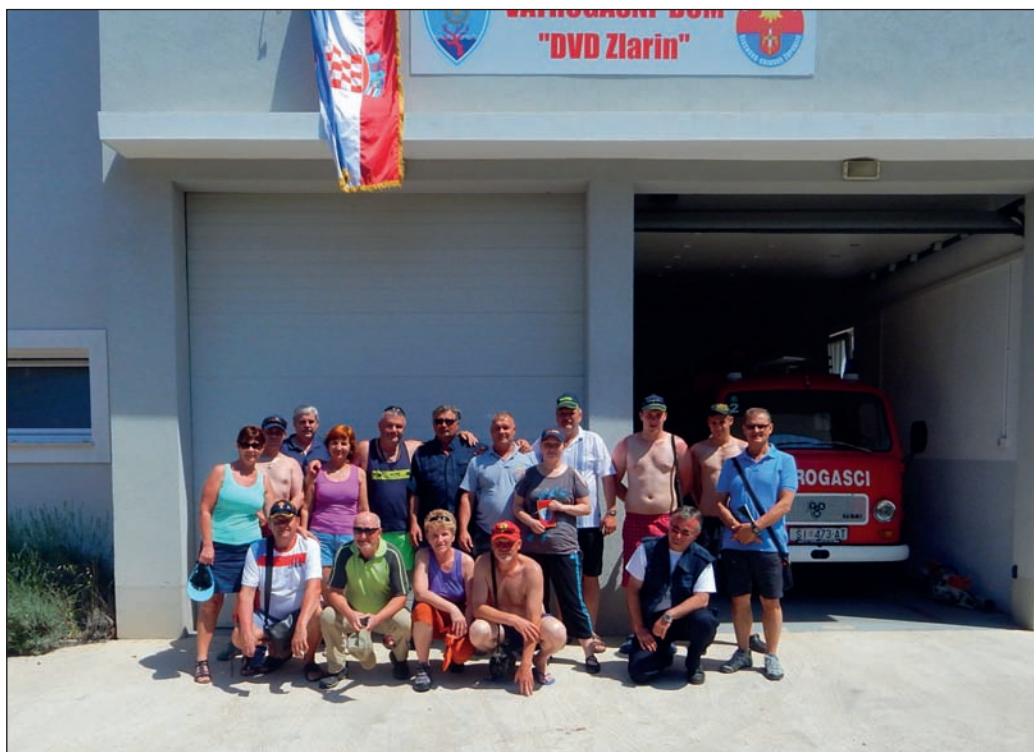
Společně s chorvatskými kolegy na ostrově Zlarin

Večer o půl osmé všichni hasiči vyrazili na místní hřiště podpořit české fotbalisty při jejich zápase s domácím Zabláce. Ba dokonce jeden z hasičů