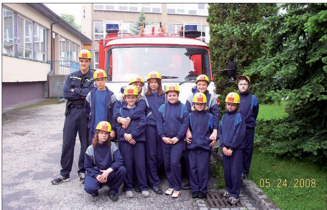
Na soutěži PLAMEN 2007-2008