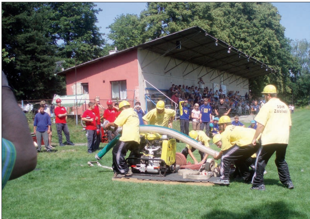
Memoriál 2007 – družstvo domácích

Civilní profesí byl pošt mistr. Této službě se věnoval celý svůj produktivní věk a sloužil na mnoha poštách v okolí. Jeho posledním působištěm před odchodem do důchodu byla pošta v Záblatí, kterou sám aktivně pomáhal v roce 1964 zřídit.