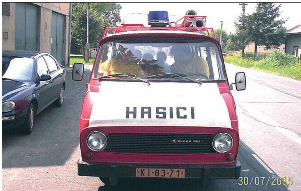
Nahoře: Škoda 1203; dole: dopravní automobil Avia A31K