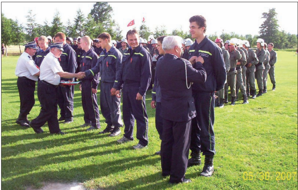
Ocenění družstva na soutěži v Polsku