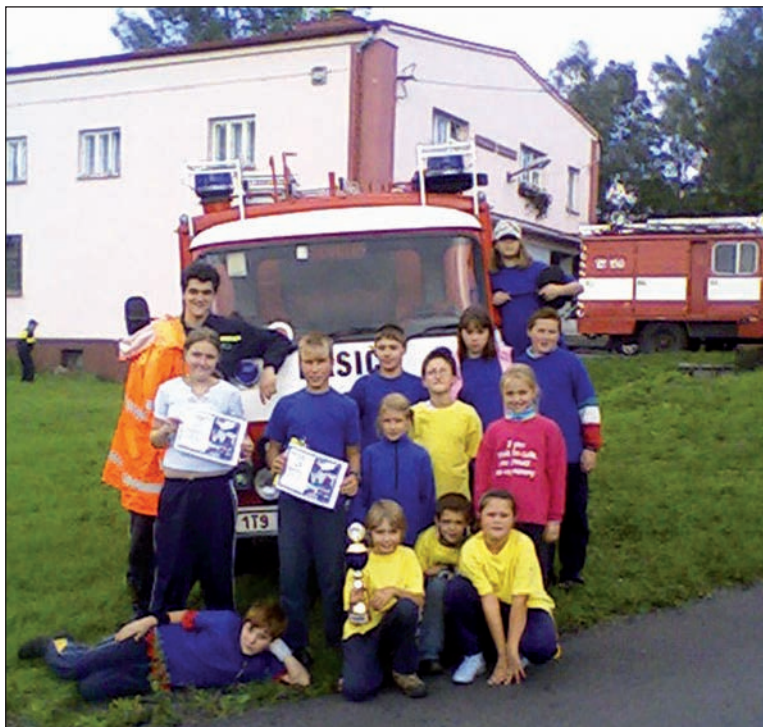
Po soutěži, Doubrava 2007