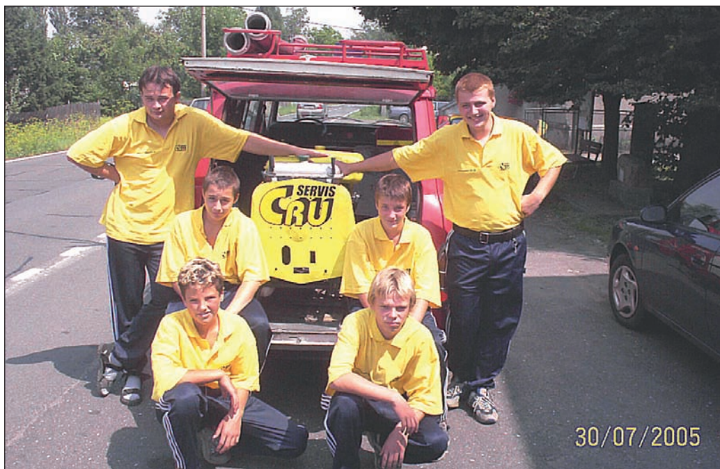
Nahoře: družstvo dorostu; dole: soutěž mladých hasičů Orlová 10. 5. 2008