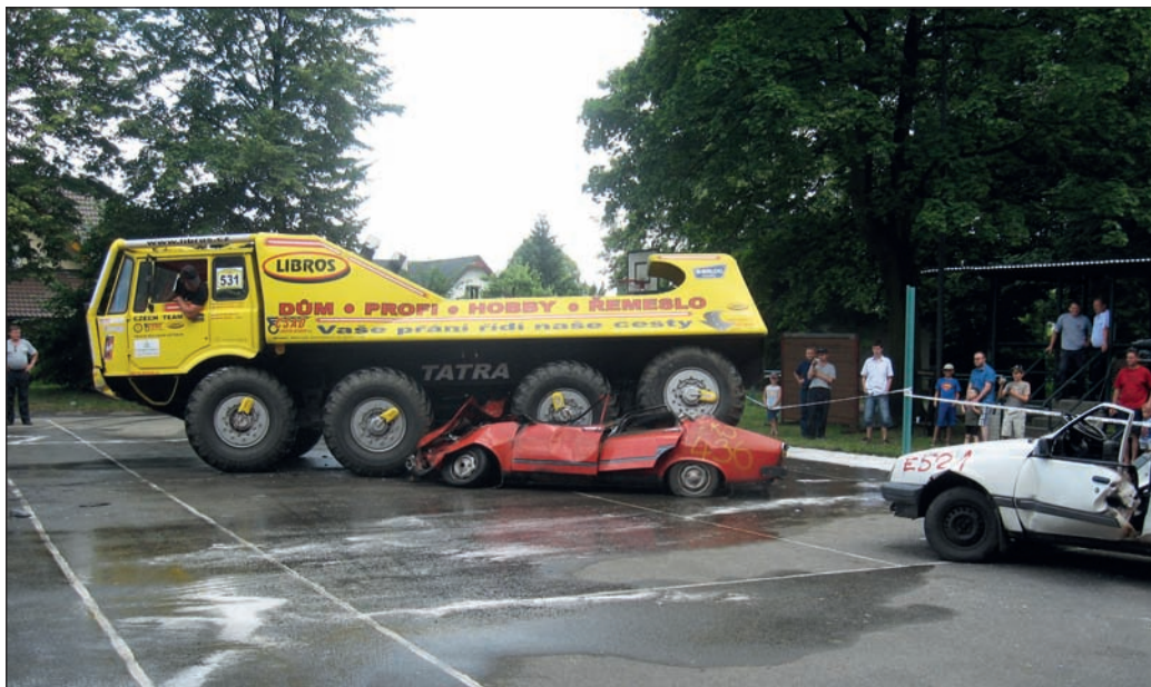
Nahoře: truck-trialová Tatra 815; dole: vyprošťovací vozidlo Mercedes Benz „Bison“