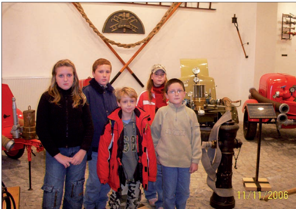
Návštěva Hasičského muzea v Ostravě