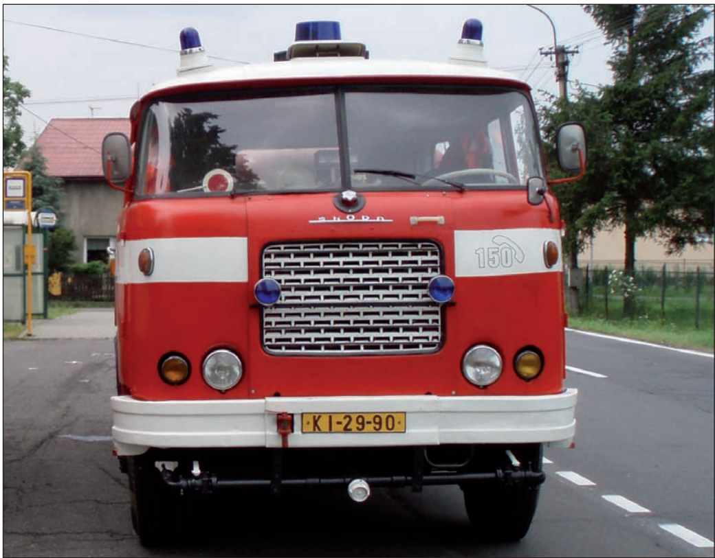
Nahoře: Škoda 706 RTHP CAS 25; dole: ZIL 131