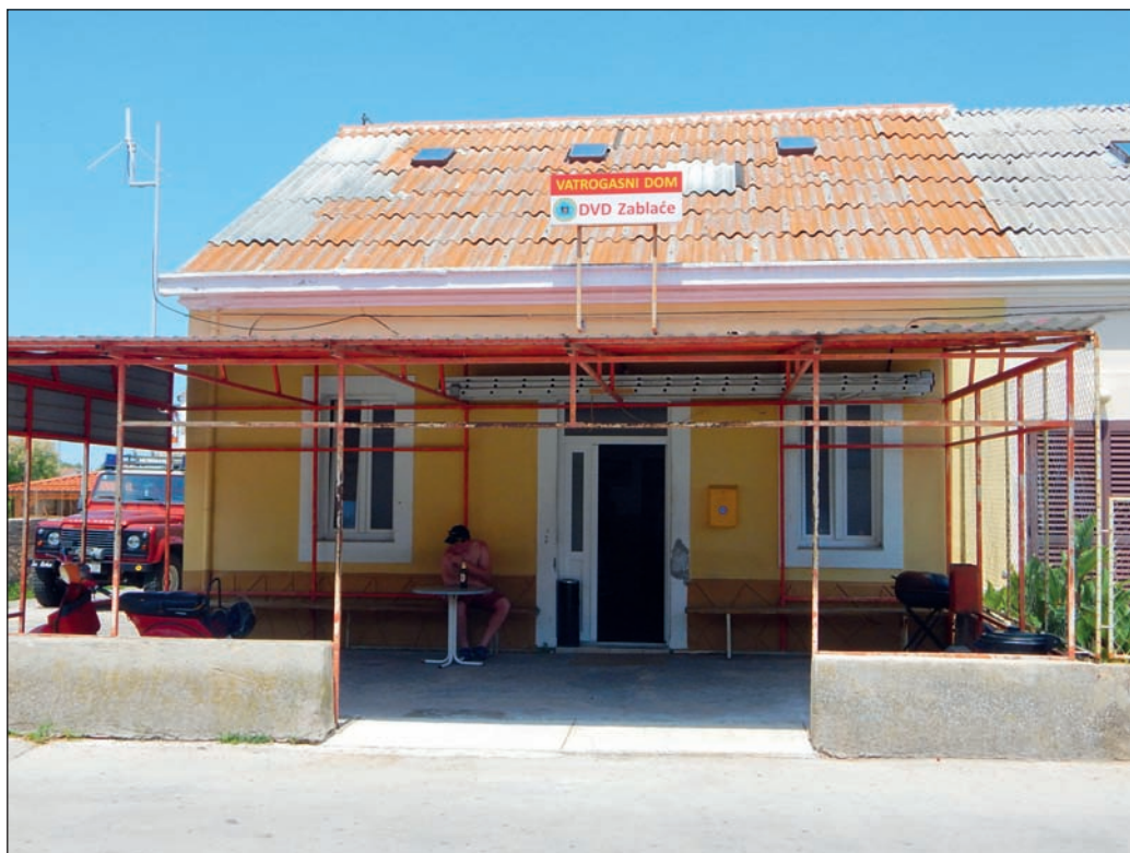
Hasičská stanice v Zablaće

„vatrogasci“ (chorvatsky „hasiči“) z D.V.D. (Dobrovolne vatrogasne društvo) Zablaće. Zbytek dne bylo osobní volno, tak samozřejmě všichni skončili u krásně čistého a celkem teplého Jadranu.