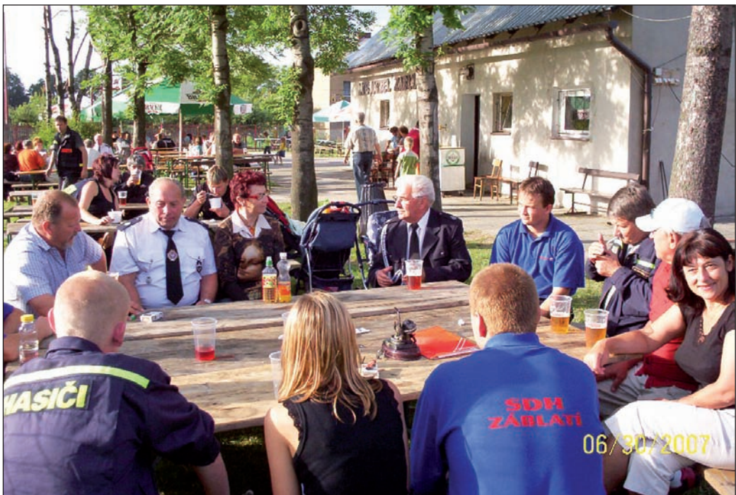
Společně při zábavě, Zabłocie, Polsko, 30. 6. 2007