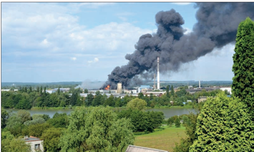
Jednotka zasahovala i při největším požáru v ČR v roce 2016 – požár mořírny v ŽDB Drátovna, a.s. Škoda dosáhla 235 mil. Kč.