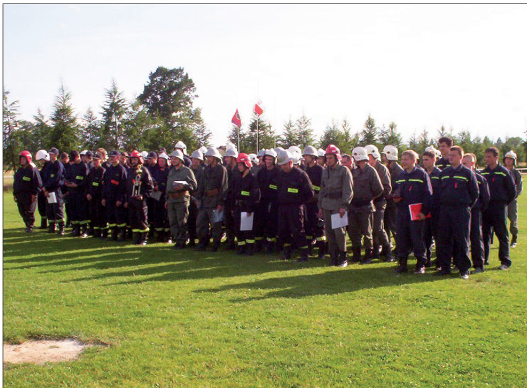
Zabłocie, Polsko, 30. 6.2007