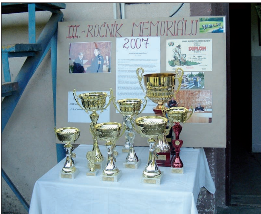
Ceny pro vítěze