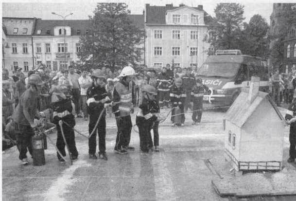
Zahájení výstavy, které se konalo v neděli na náměstí TGM, doprovázel i zásah mladých hasičů z Kopytova.

Přepálením stuhu svíci za asistence hasičů a starosty Bohumína začala společná týdenní výstava všech sborů dobrovolných hasičů z Bohumína v salónu Maryška na náměstí T.G.Masaryka.