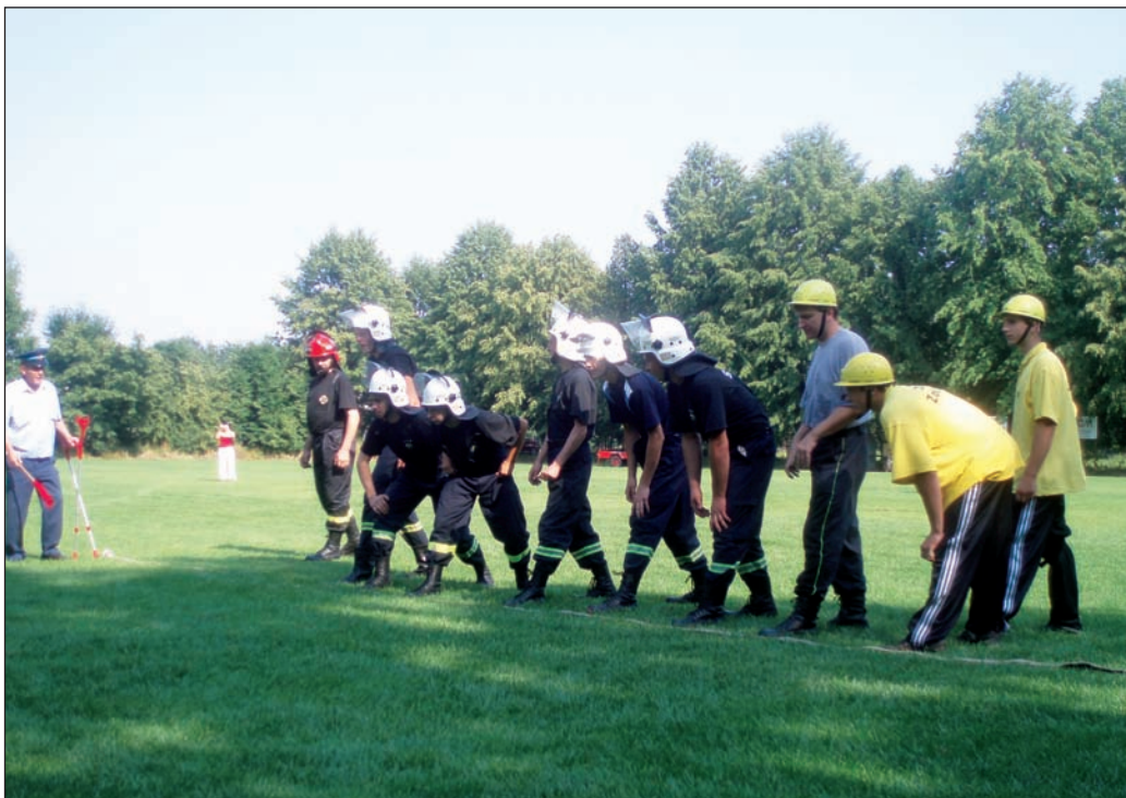
Memoriál 2007 – družstvo polských kolegů