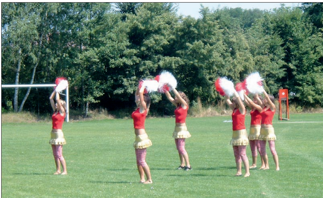
Memoriál 2007 – polské mažoretky