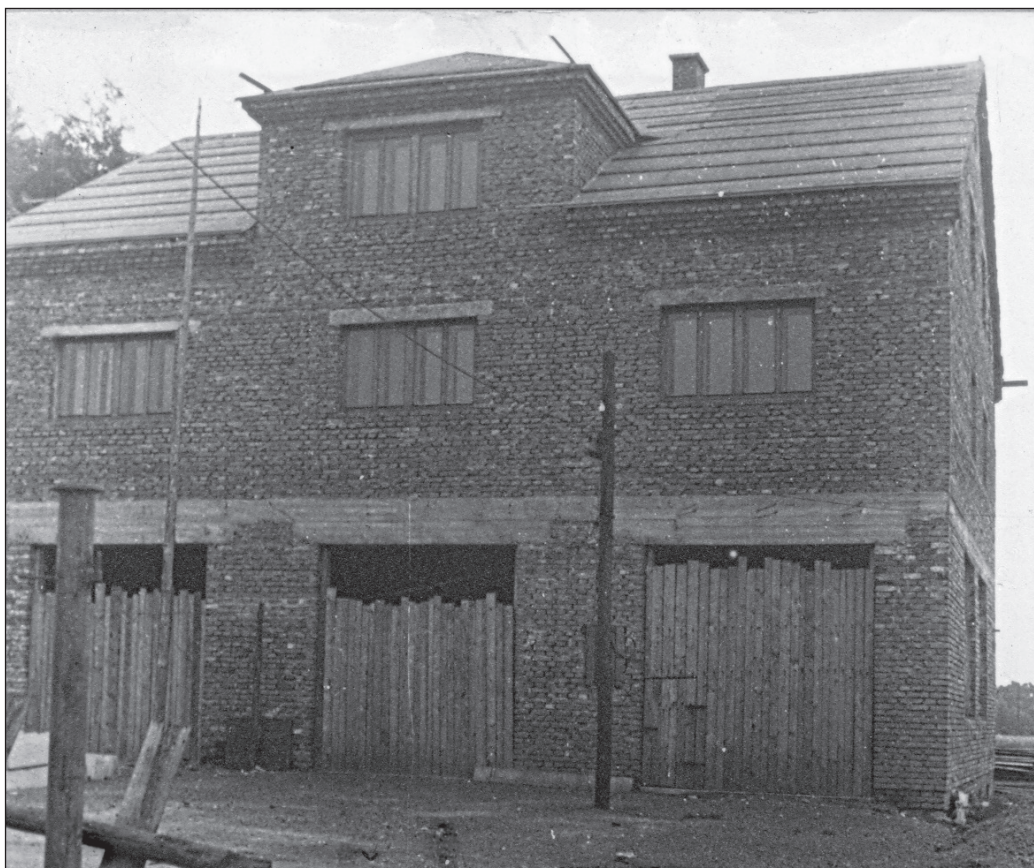
Stavba nové zbrojnice

Na výborové schůzi dne 11. 3. 1954 proběhly první přípravy pro zahájení výstavby nového stánku hasičů. Stávající zbrojnice — hasičský sklad — již nevyhovovala potřebám sboru a bylo rozhodnuto o výstavbě nové zbroj-