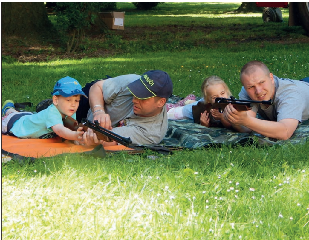
Dětský den s hasiči 2017