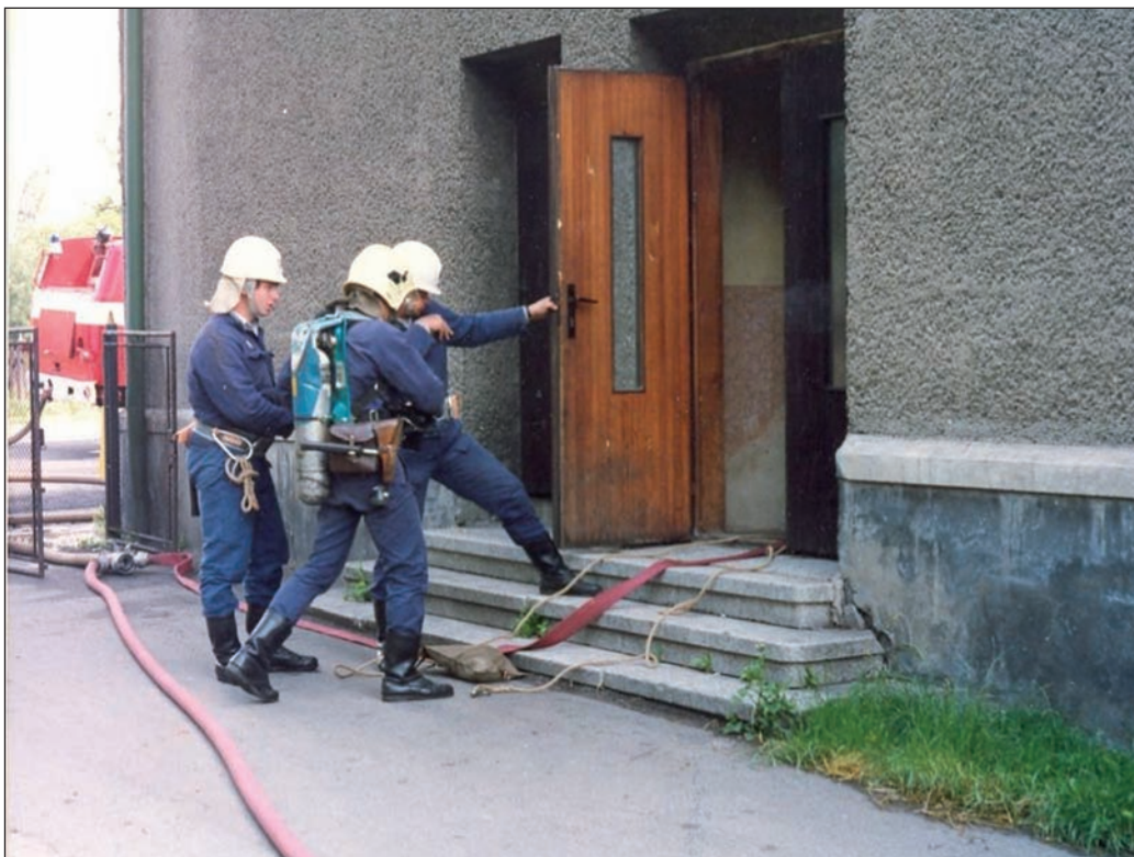
Oslavy 100 let – nahoře: záchranný vrtulník; dole: námětové cvičení