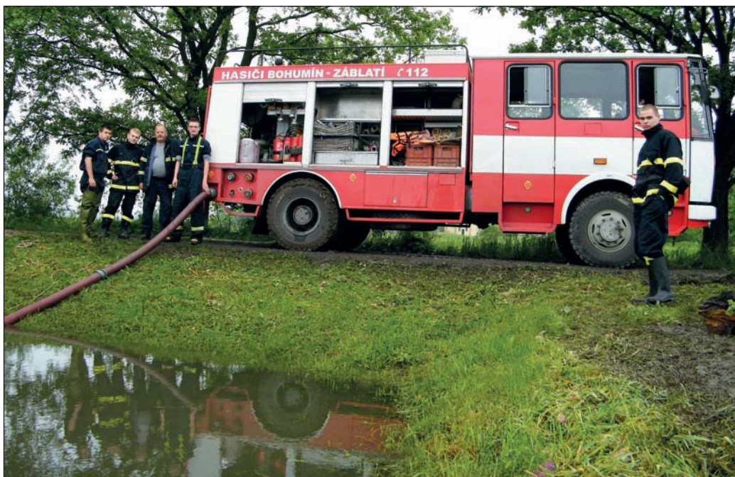
Povodně 2010 – čerpání zatopených zahrad