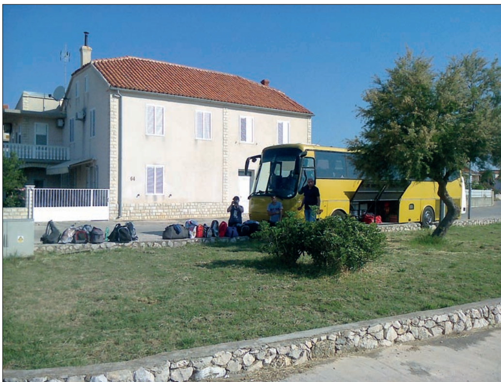
Příjezd do Zabláče

Přibližně 20 fotbalistů a 15 hasičů i hasiček čekala celonoční cesta pohodlným klimatizovaným autobusem. Po ujetí téměř přesně jednoho tisíce kilometrů jsme ráno kolem půl deváté vystoupili u přístavu v malé obci Zabláče, vzdálené 8 km od Šibeniku. Přivítalo nás krásné letní počasí s teplotami od 30 do 35 stupňů, které se drželo po celou dobu pobytu. Po uvítání domácími zástupci obou spolků jsme byli ubytováni v několika apartmánových domech pár kroků od moře. Obě skupiny se formálně rozdělily, fotbalisty čekaly dva mezinárodní zápasy a hasiče program připravený místními