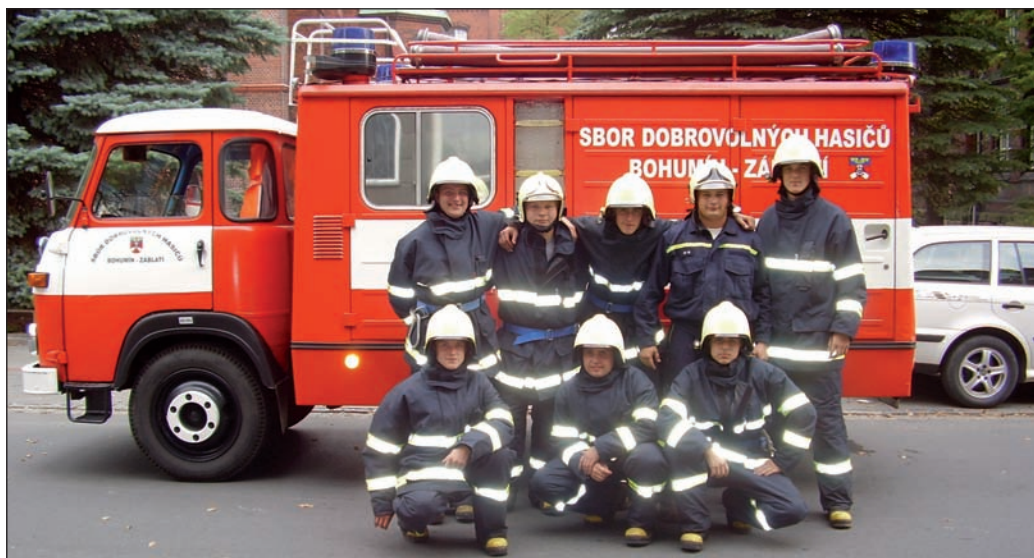
Jednotka při výjezdu s DA AVIA A31K (2009)

V roce 2007 uskutečnila celkem 67 výjezdů, z toho 60 při likvidaci bodavého hmyzu, 2 zásahy u dopravních nehod, 2 zásahy při větrné smršti, 2x čerpání vody a 1x technická pomoc.