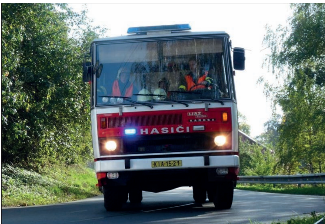
Liaz při výjezdu (2017)